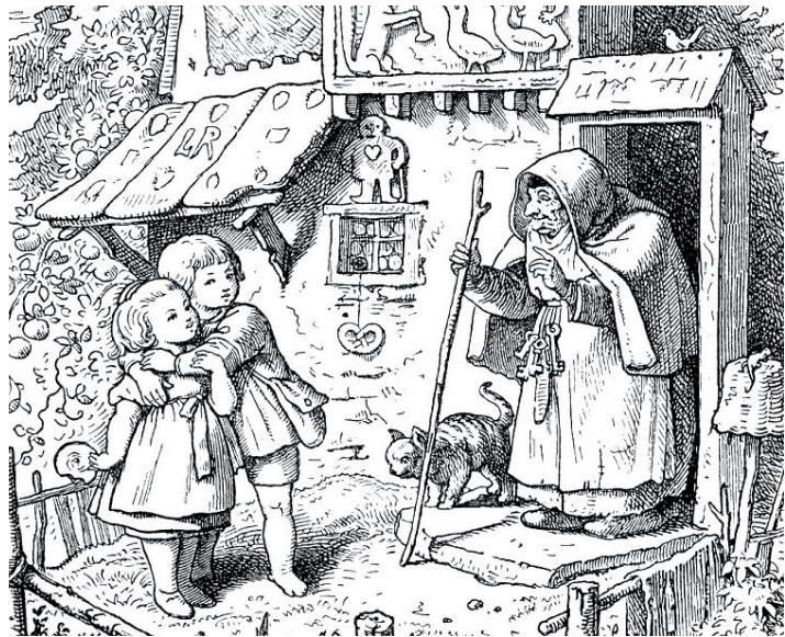
Welches Märchen das wohl ist? Buchillustration um 1903

Unser Geschichtenfestival verfolgt neben dem primären Sinn, nämlich ein Hör- und Staunabenteuer für kleine und grosse Menschen zu sein, noch ein weiteres Ziel. Es will Zuhörern aller Altersgruppen die Möglichkeit geben, in zeitlich kurzer Folge verschiedenen Erzählerinnen und Erzählern zu lauschen. Im Einklang mit dem eigenen Erleben kann so ein erstes Urteilsvermögen über diese Kunst ausgebildet werden.